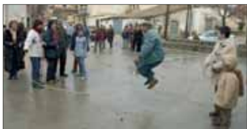
Escuelas Campesinas de Salamanca, empeñados en que los mayores permanezcan en el pueblo

Atención a las personas mayores desde la cercanía