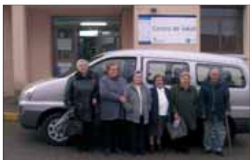
Escuelas Campesinas de Palencia

Educadora Social, responsable del programa de mayores que se lleva a cabo en Cervantes, Lugo